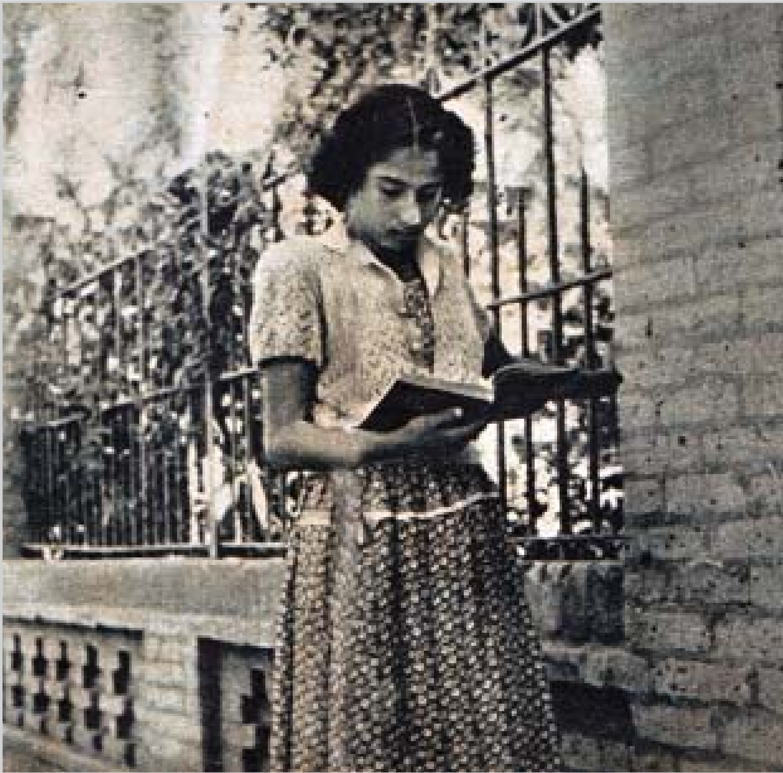
نازك الملائكة في صورة نادرة تنشر للمرة الاولى

تكرت نازك الملائكة مرارا ان بداية عشقها لزوجها نازك الملائكة، سجل فيها مشاهداته وما وقع له في تلك الرحلة، ولم تنشر هذه الرحلة منطقة (ابو قلام) في الكراوة الشرقية، وبقيت هذه تساعد في ادارة البيت وتربية الابناء، ان لم تتزوج وعانت البتم مبكرا، وتوفيت عام ١٩٤٨. ولها اخت متزوجة من احد رجال اسرة اللوس.